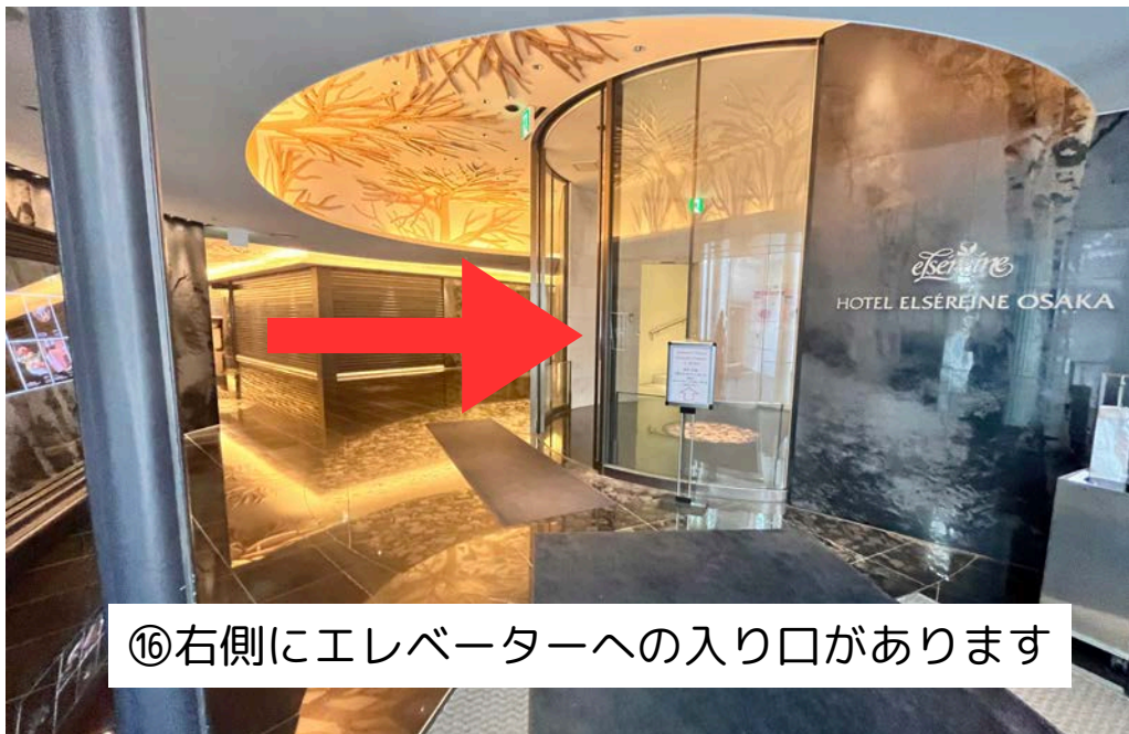
⑩右側にエレベーターへの入り口があります