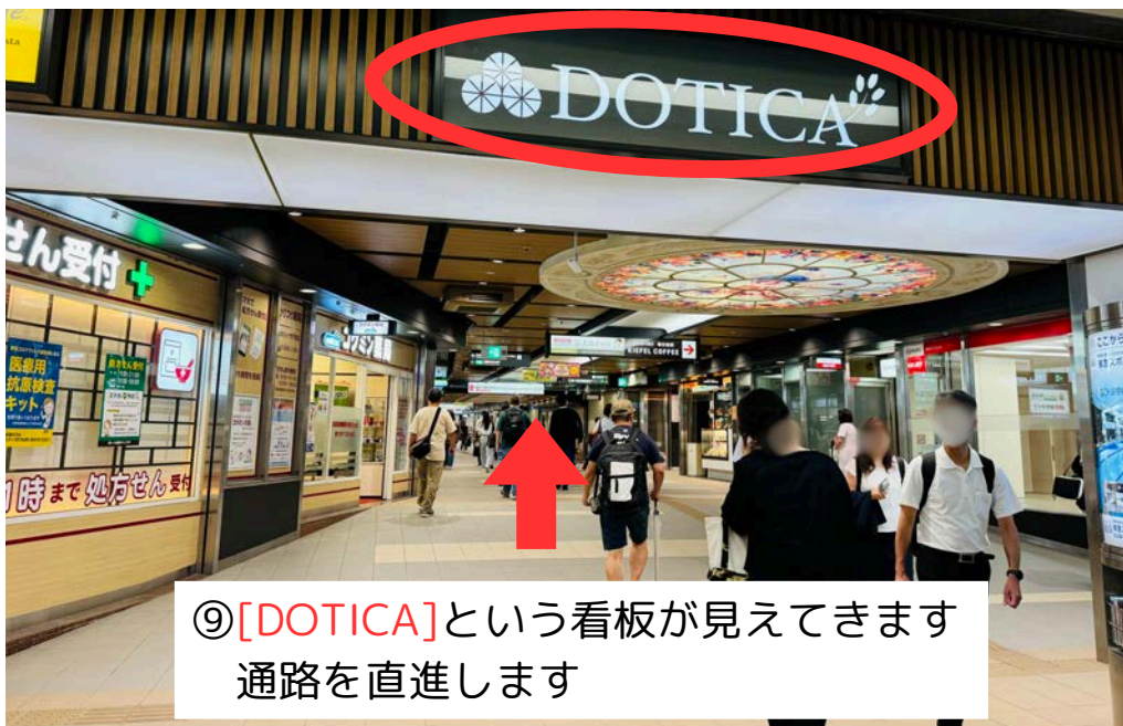
⑨[DOTICA]という看板が見えてきます 通路を直進します