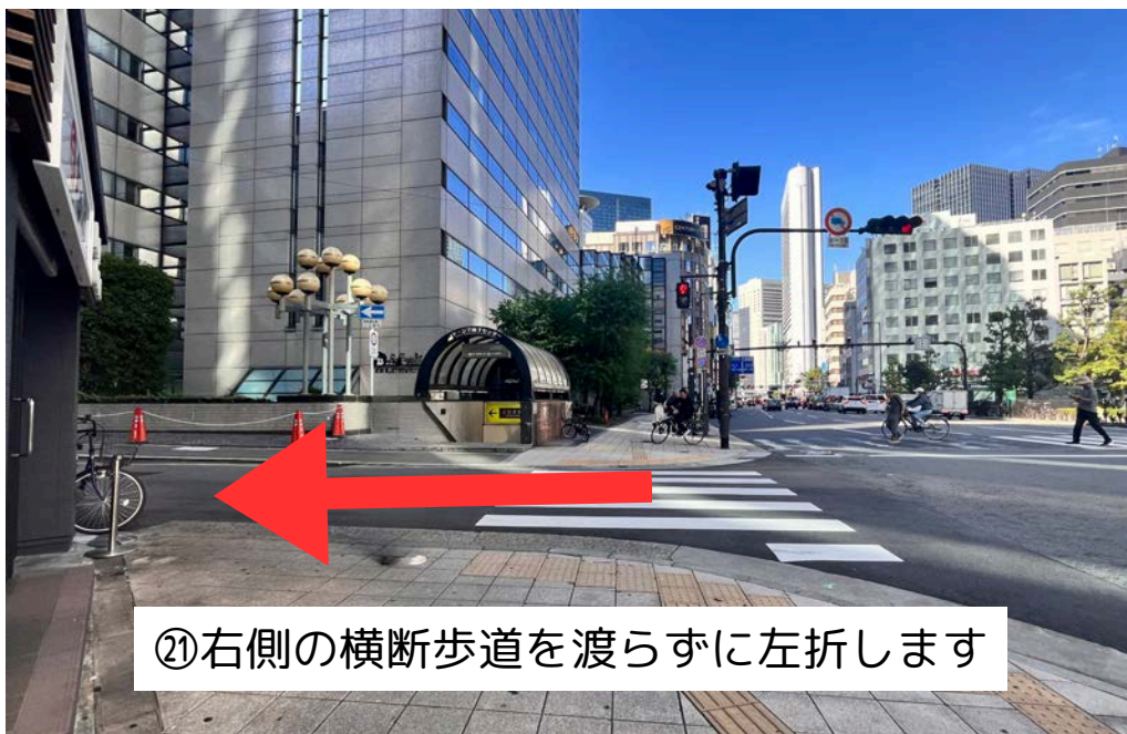
㉑ 右側の横断歩道を渡らずに左折します