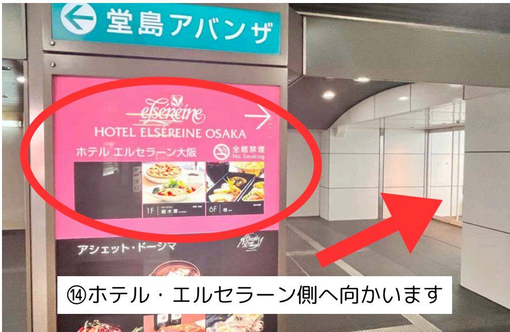
⑭ホテル・エルセラーン側へ向かいます