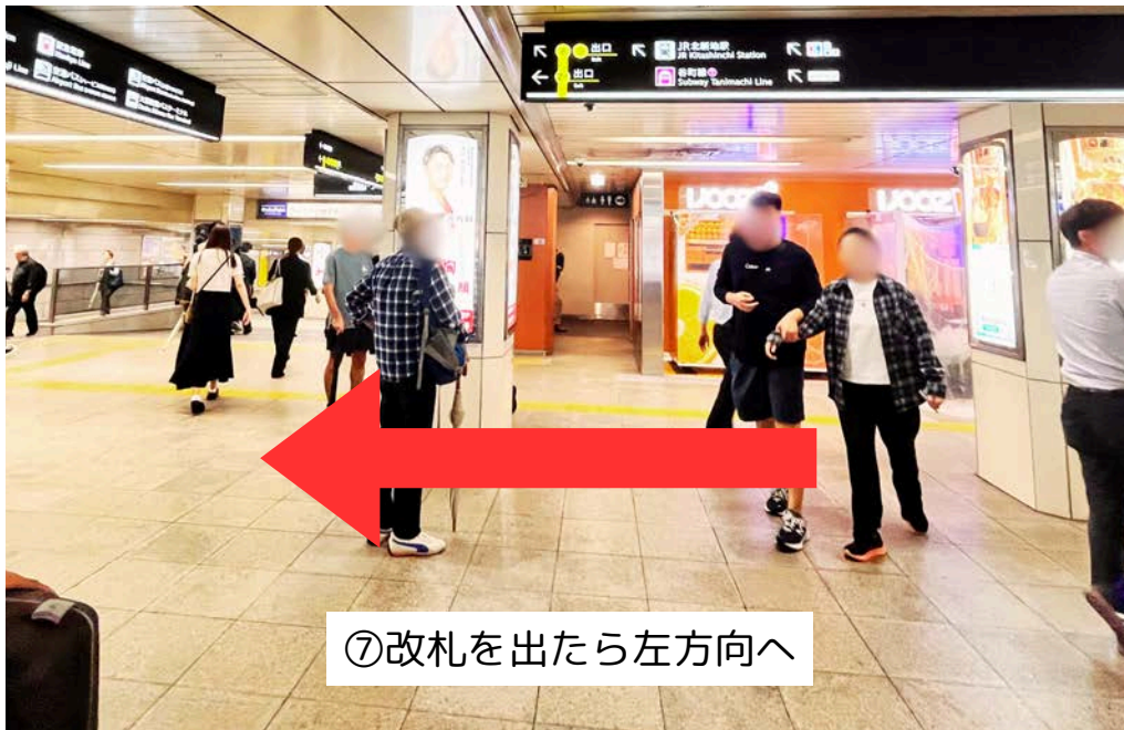
⑦改札を出たら左方向へ