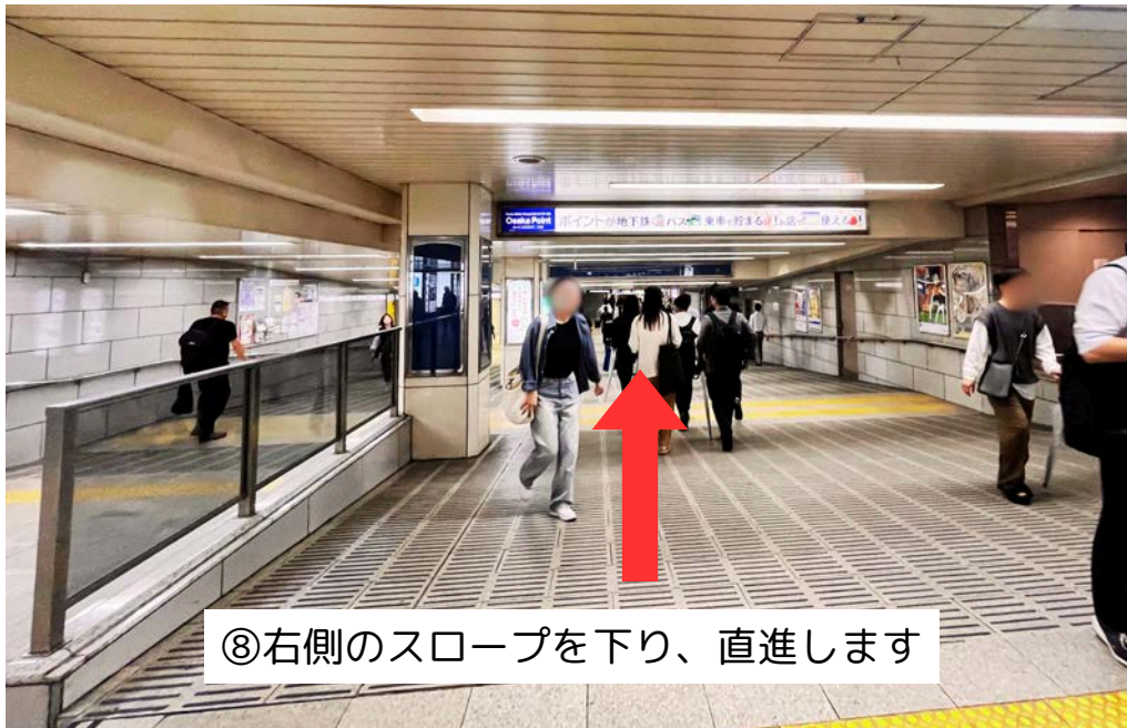
⑧右側のスロープを下り、直進します