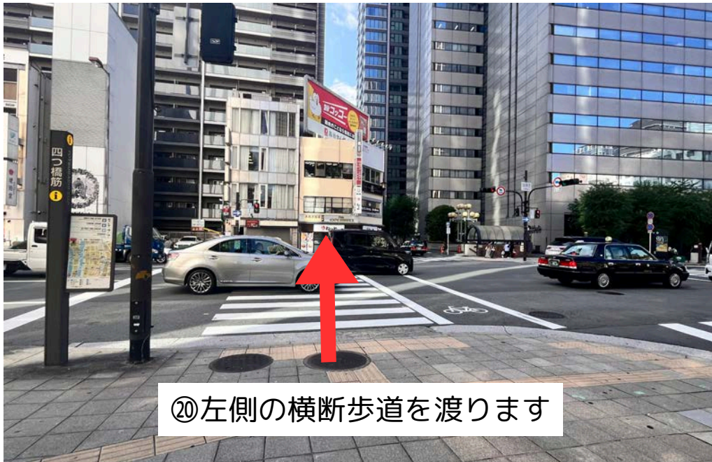
⑳ 左側の横断歩道を渡ります