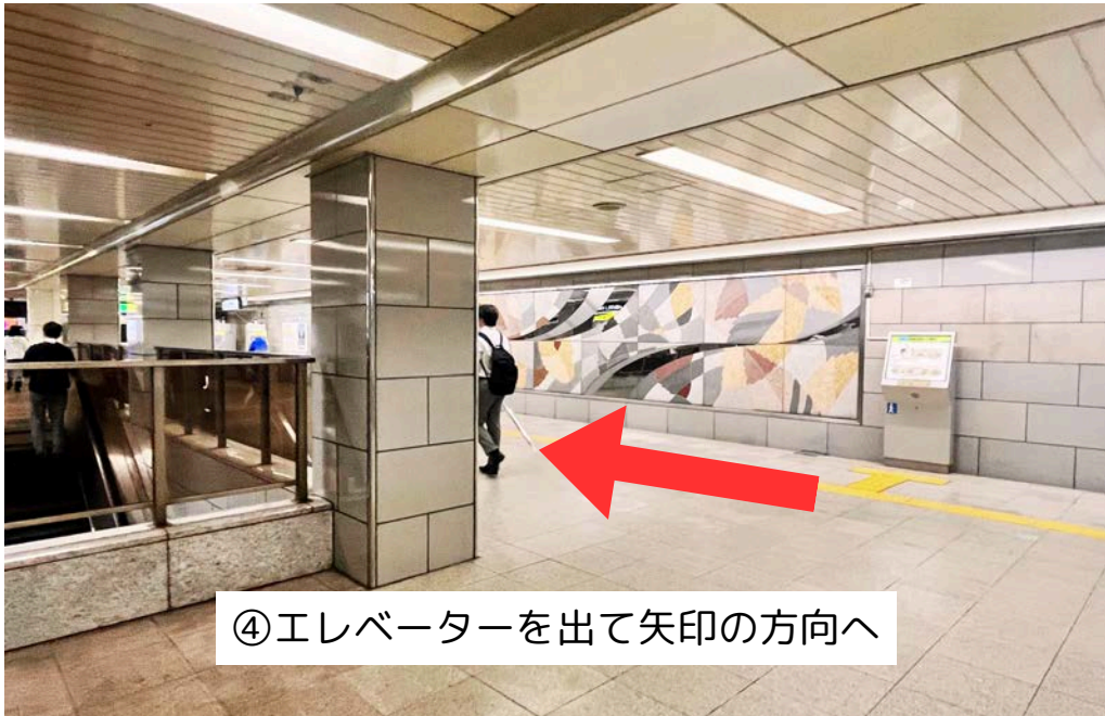
④エレベーターを出て矢印の方向へ