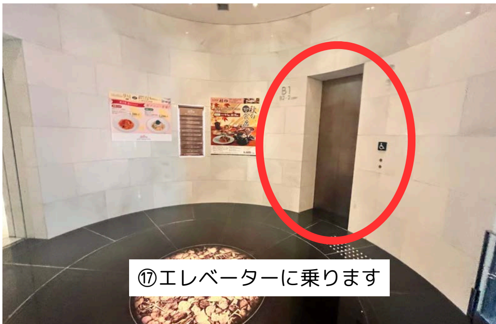
⑪エレベーターに乗ります