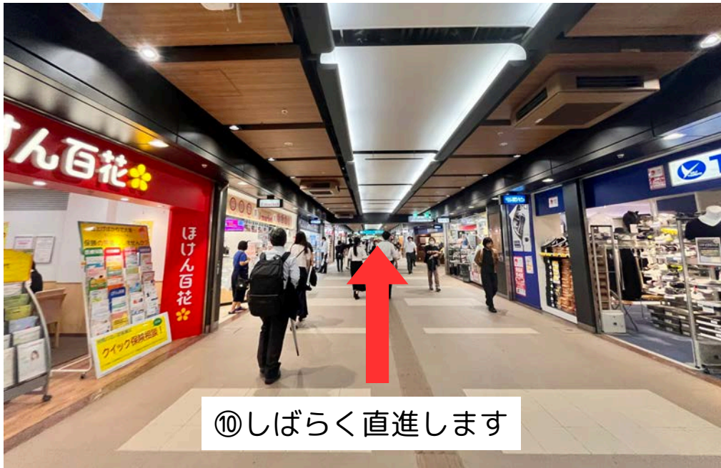
⑩しばらく直進します