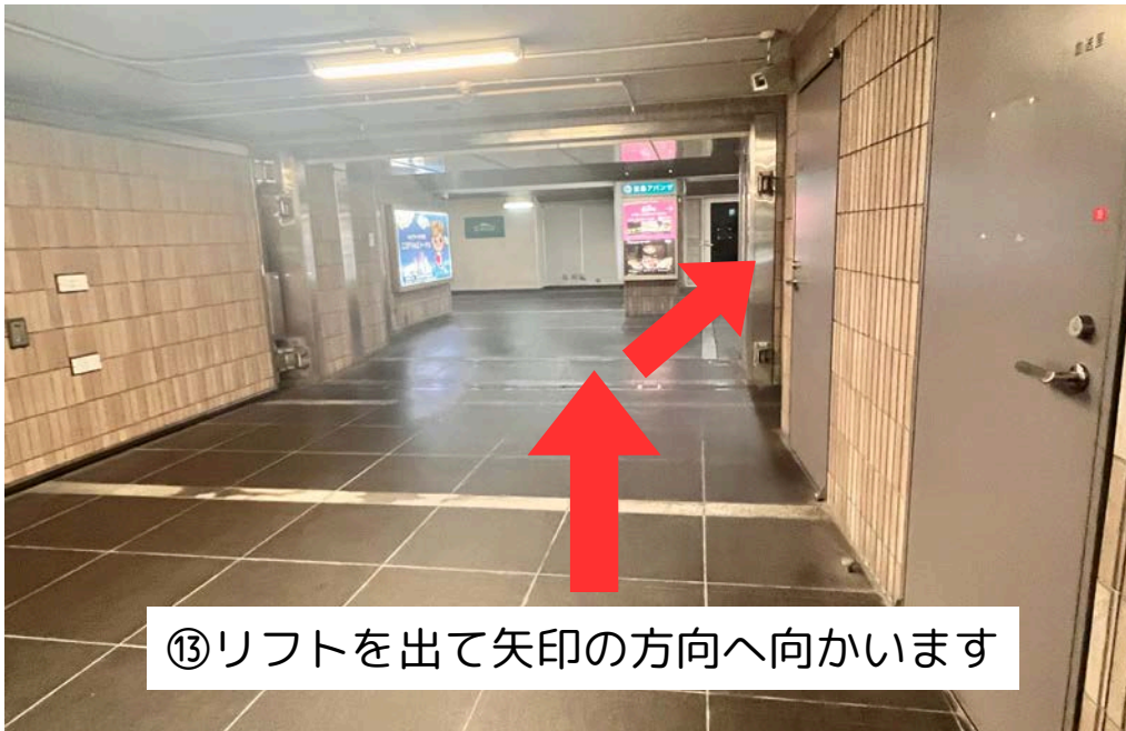
⑬リフトを出て矢印の方向へ向かいます