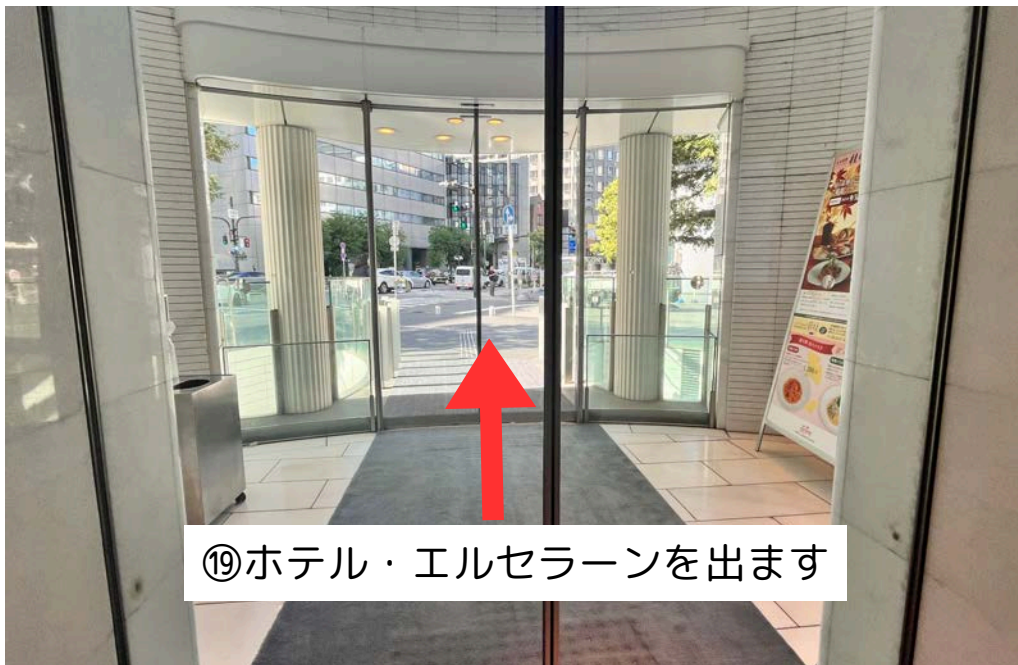
⑱ ホテル・エルセラーンを出ます