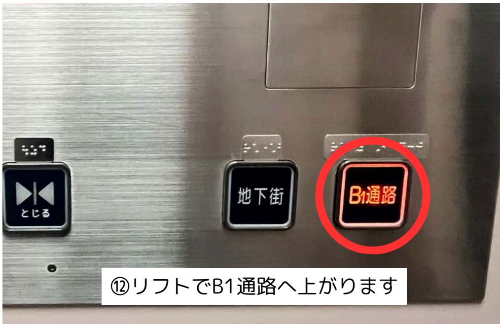
⑫リフトでB1通路へ上がります