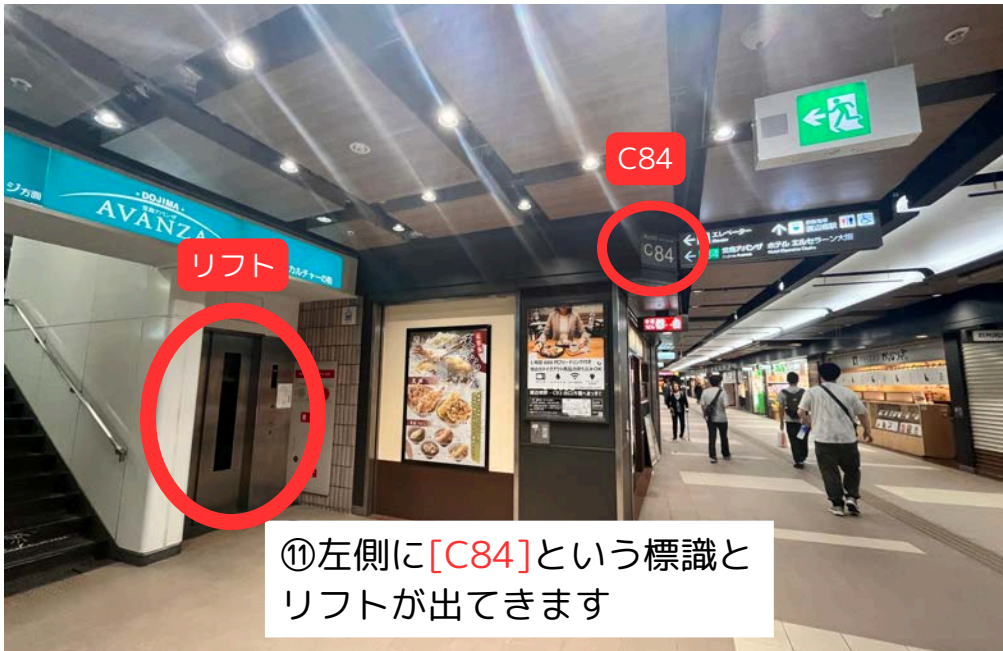
⑪左側に[C84]という標識と リフトが出てきます