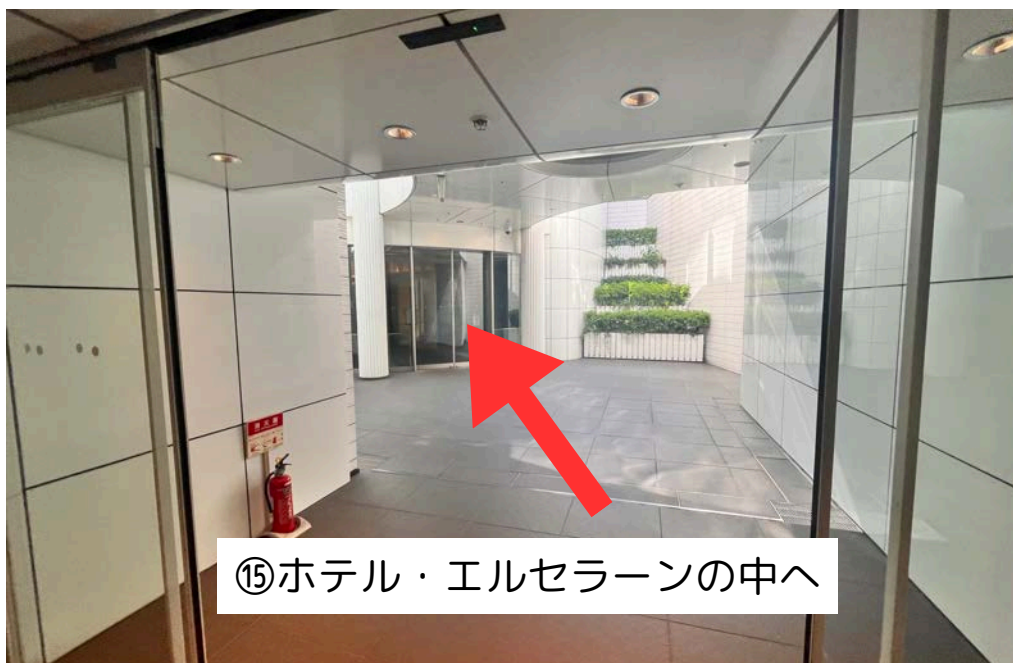
⑮ホテル・エルセラーンの中へ